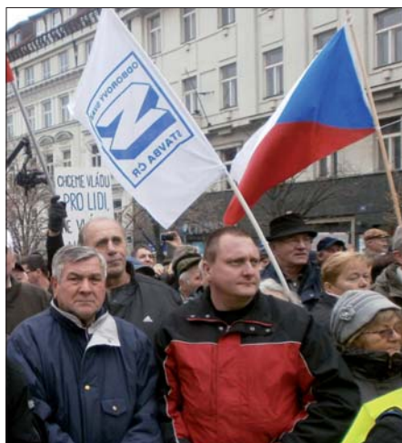
Své oprávněné požadavky prosazujeme.

průmyslu a obchodu Martin Kuba a další ministři říkali, že tato opatření budou podporovat rozvoj vědy a výzkumu, učňovské a odborné školství atd. Když jsme se jako sociální part-