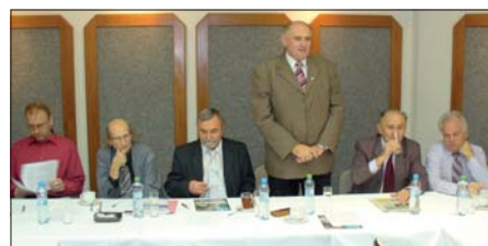
Uvítání seniorů na tradičním setkání.

Stavba ČR, jednou poděkoval účastníkům setkání za jejich dlouholetou a příkladnou práci