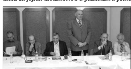
Uvítání seniorů na tradičním setkání.

Stavba ČR, jednou poděkoval účastníkům setkání za jejich dlouholetou a příkladnou práci