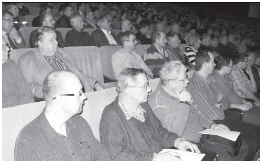
Celostátního protestního shromáždění ČMKOS se zúčastnilo 34 delegátů OS Stavba ČR