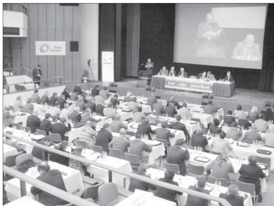
Pohled do sjezdového sálu na delegáty i předsednictvo sjezdu

odborů, ale naopak k upevnění jejich jednoty a solidarity.