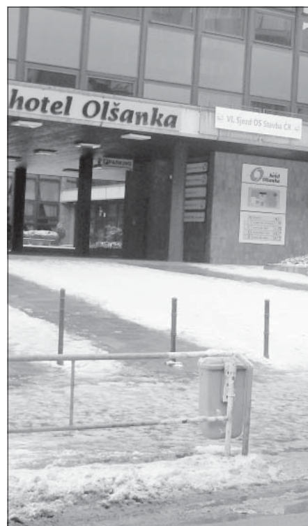
Dějiště VI. sjezdu OS Stavba ČR – hotel Olšanka v Praze na Žižkově