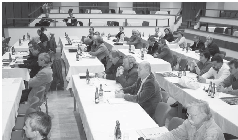
Členové Sněmu OS Stavba ČR na svém IV. zasedání ve dnech 10. a 11. 12. 2008 v pražském hotelu Olšanka