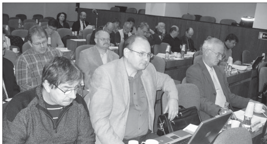
Delegáti OS Stavba ČR na V. zasedání Sněmu ČMKOS dne 25. 11. 2008 v pražské budově DOS

Úvodní slova předsedy Štěcha dále rozvinul ve svém vystoupení host sněmu – bývalý předseda ČMKOS a nynější europoslanec Richard Falbr.